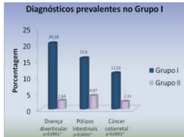
Gráfico 2 - Diagnósticos prevalentes no Grupo I.